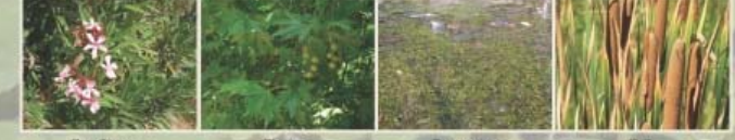
Πικροδάφνη Πλάτανος Ποταμογείτονος Ψαθί