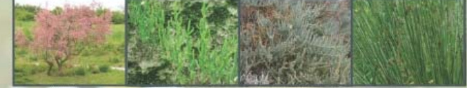
Αμμυρήθρα Αμμυρήθρα Salicornia Αμμυρήθρα Arthrocnemum Βούρλα