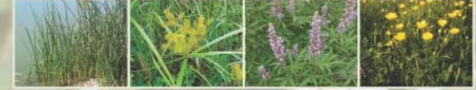
Σάβιλο Κίληρος Λυγαριά Νεραγκούλες