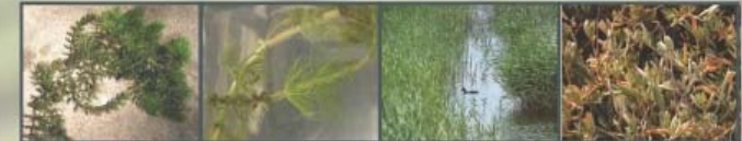
Αγγειόσπερμα - Κερκίραλλο Αγγειόσπερμα - Μικράραλλο Αγγειόσπερμα Αγγειόσπερμα